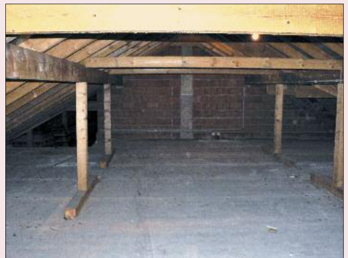
Der Seminarraum vor dem Umbau (andere Seite).