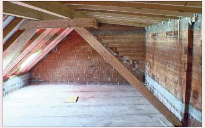
Der neu gewonnene Raum.