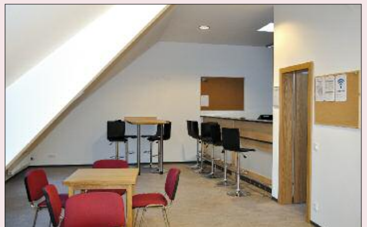
Der neue Mannschaftsraum nach dem Umbau.