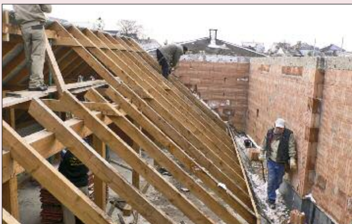
Die neuen Außenwände sind fertig.