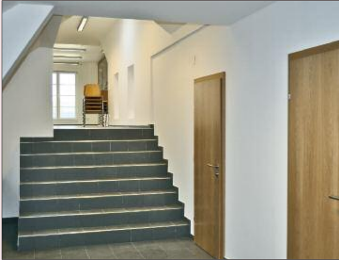
Nach dem Umbau.