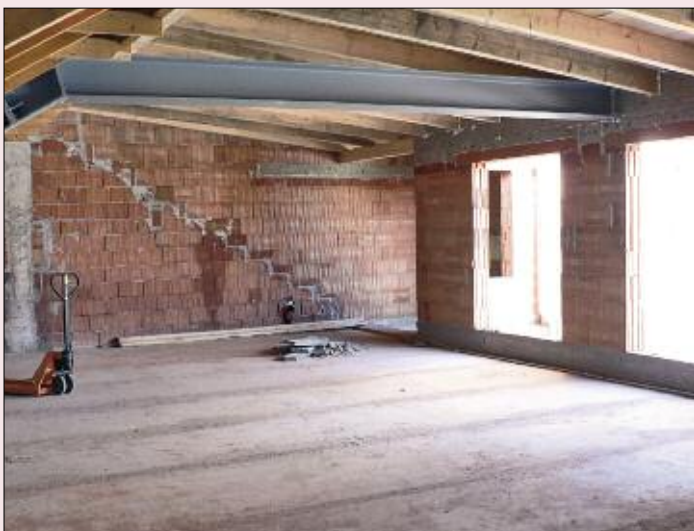
Das neue Dach ist gedeckt.