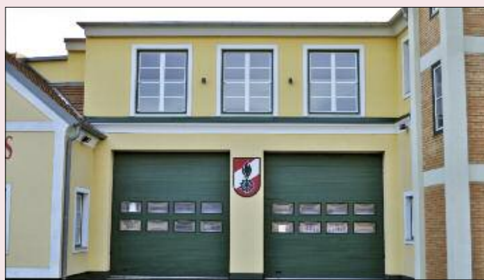
Nach dem Umbau.