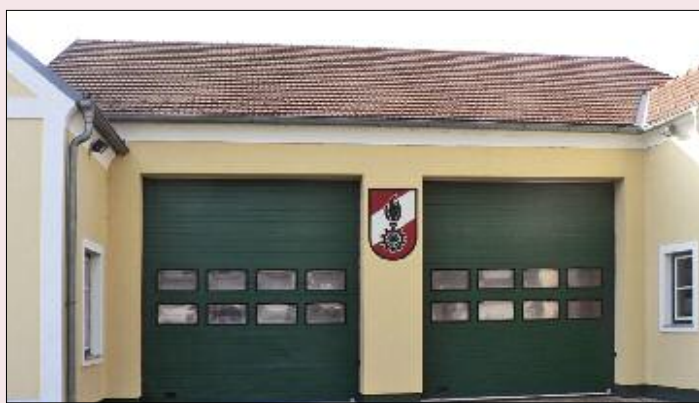
Vor dem Umbau.

Hier einige Impressionen vom Zu- und Umbau des Feuerwehrhauses.