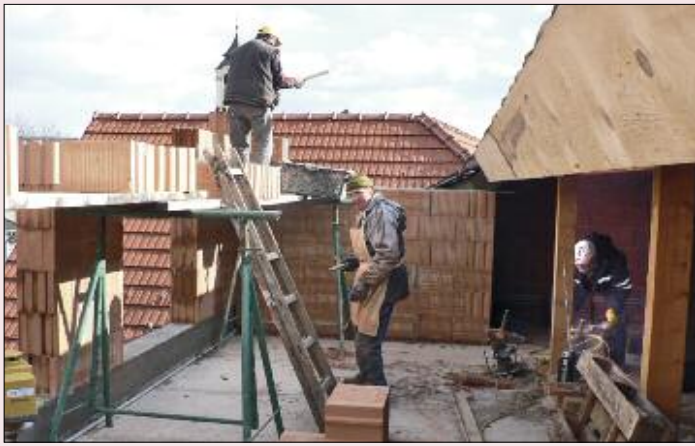
Aufmauerungsarbeiten im Obergeschoß.