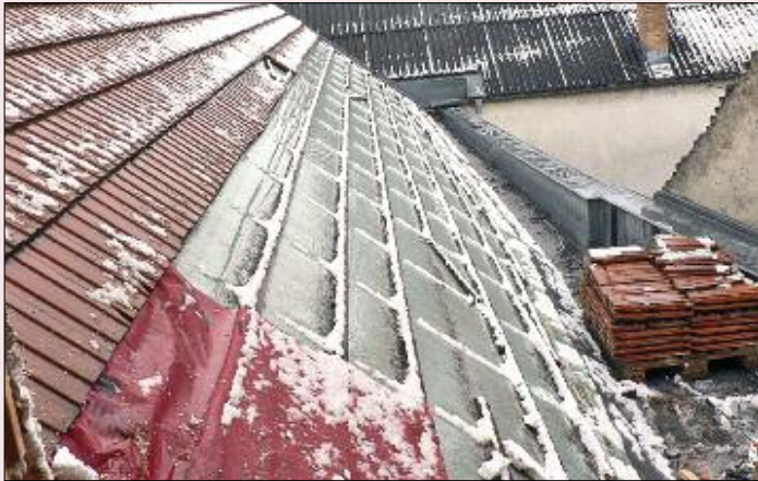
Der Dachstuhl über dem Mannschaftsraum vor dem Umbau.