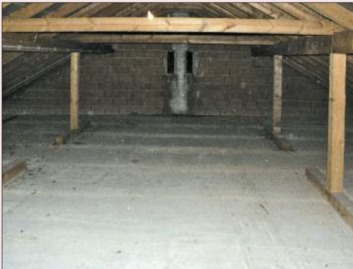
Der Seminarraum vor dem Umbau.