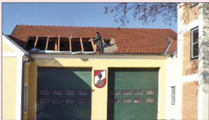
Das Dach wird abgedeckt.