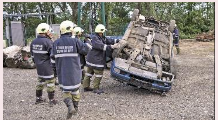
Übung Technischer Einsatz - simulierter Verkehrsunfall mit eingeklemmter Person.