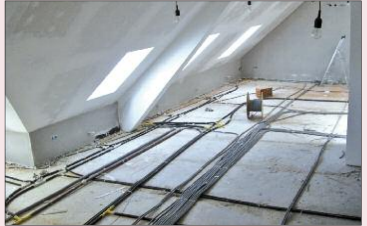
Der Innenausbau ist fast fertig.