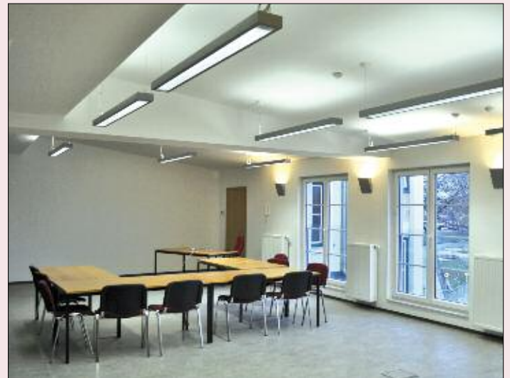
Der neue Seminarraum nach dem Umbau.