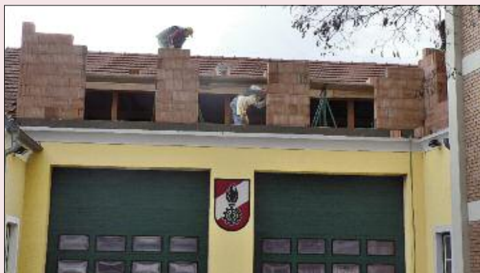
Aufmauerungsarbeiten im Dachgeschoß.