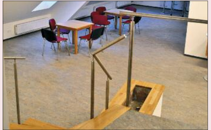
Handläufe sind montiert, neue Möbel aufgestellt.