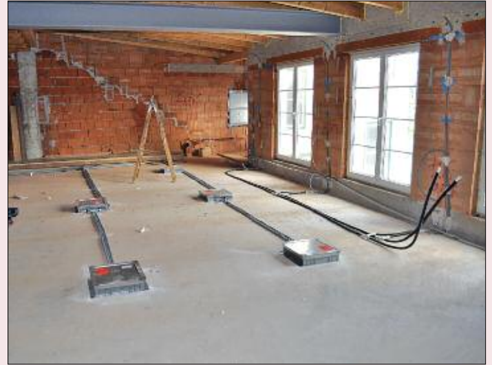
Elektro- und Heizungsinstallationen werden verlegt.