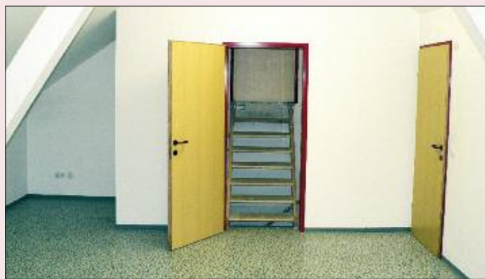
Das Obergeschoß vor dem Umbau.