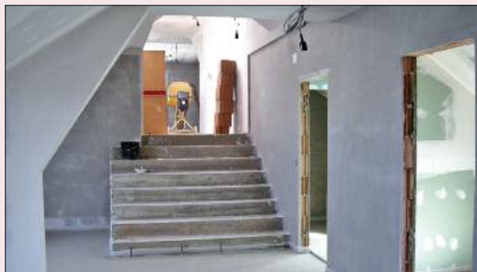
Der neue Zugang ins Obergeschoß.