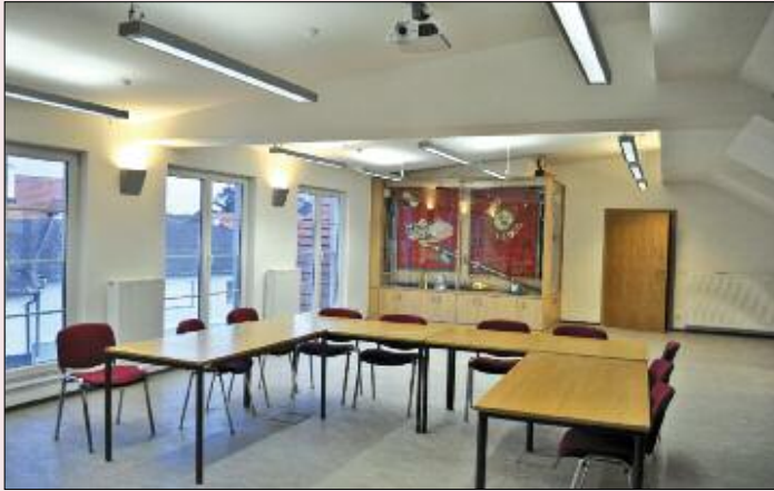
Der neue Seminarraum nach dem Umbau.