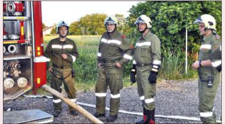
Übung Brandeinsatz - Übungsannahme war ein Brand in der Leichenhalle am Friedhof.